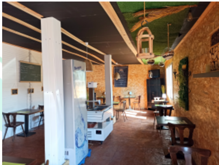
L'Escale ZAC du Bouquet Tél. 03.84.49.03.46

Il y aura toujours une occasion pour vous de vous rendre à l'Escale !