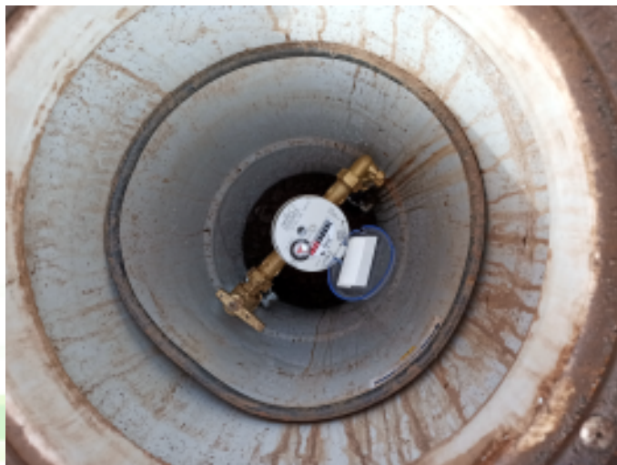
compteur d'eau installé en limite de propriété

Coût des travaux : 700 000 € HT dont 100 000 € HT pour 90 branchements de particuliers de la maison en bordure du domaine public (le financement a été pris en charge par la commune).