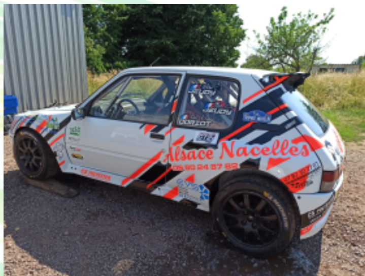
MLJ auto 19 rue Victor Hugo Tél. 06.82.84.09.97

Proposant l'entretien courant des véhicules, la réparation mécanique, mais aussi la vente et le montage de pneumatiques, il apportera son savoir-faire pour votre sécurité.