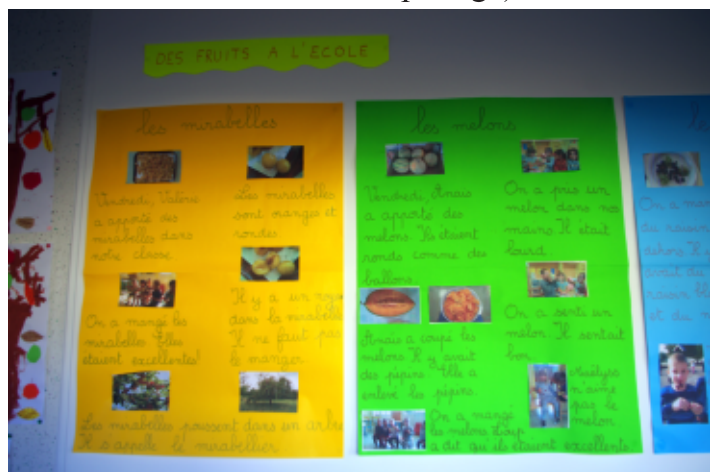
Panneaux réalisés autour de la dégustation du fruit

Si la découverte du fruit est réelle pour beaucoup d'enfants, elle se révèle au final le point de départ d'un travail éducatif plus complet réalisé en classe.