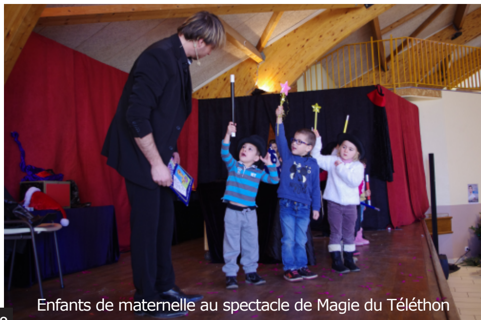
Enfants de maternelle au spectacle de Magie du Téléthon

Les plus grands font un travail plus élaboré autour de la pomme avec une déclinaison de tartes, gâteaux et compotes.