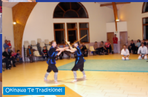
Okinawa Te Traditionel