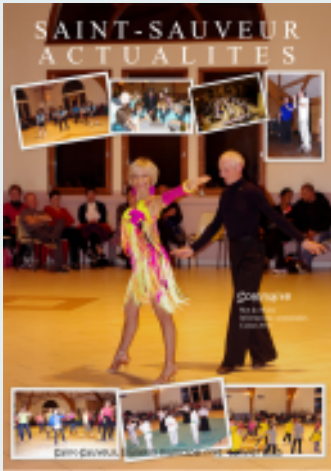
Les revues sont disponibles en téléchargement depuis le site de la Mairie