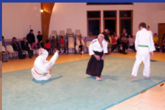
Club salvatorien d'Aïkido Budo