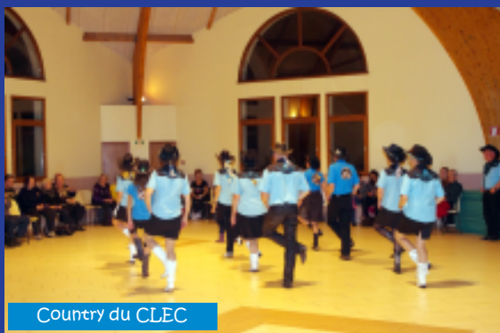
Country du CLEC