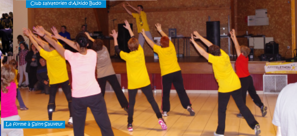
La Forme à Saint-Sauveur