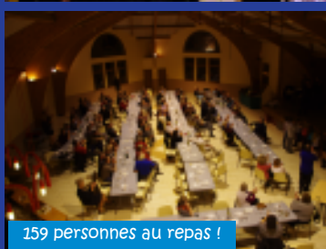
159 personnes au repas !