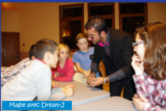
Magie avec Dream-J