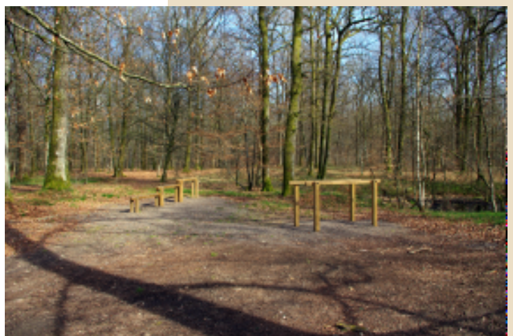
Agrès actuellement installés au départ du parcours de santé