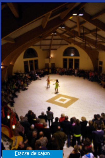
Danse de salon