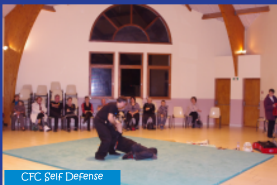
CFC Self Defense