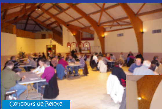
Concours de Belote

Un grand merci aux bénévoles, associations, commerçants, artisans et au public qui rendent cette journée exceptionnelle !